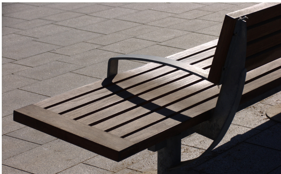
Barceloneta, Barcelona (Spain)

Banc NU de 3,70 m avec dossier, bois de pin rouge / bois tropical: 79 Kg / 109 Kg.