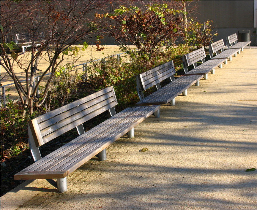
Vaucanson, Patin (France)