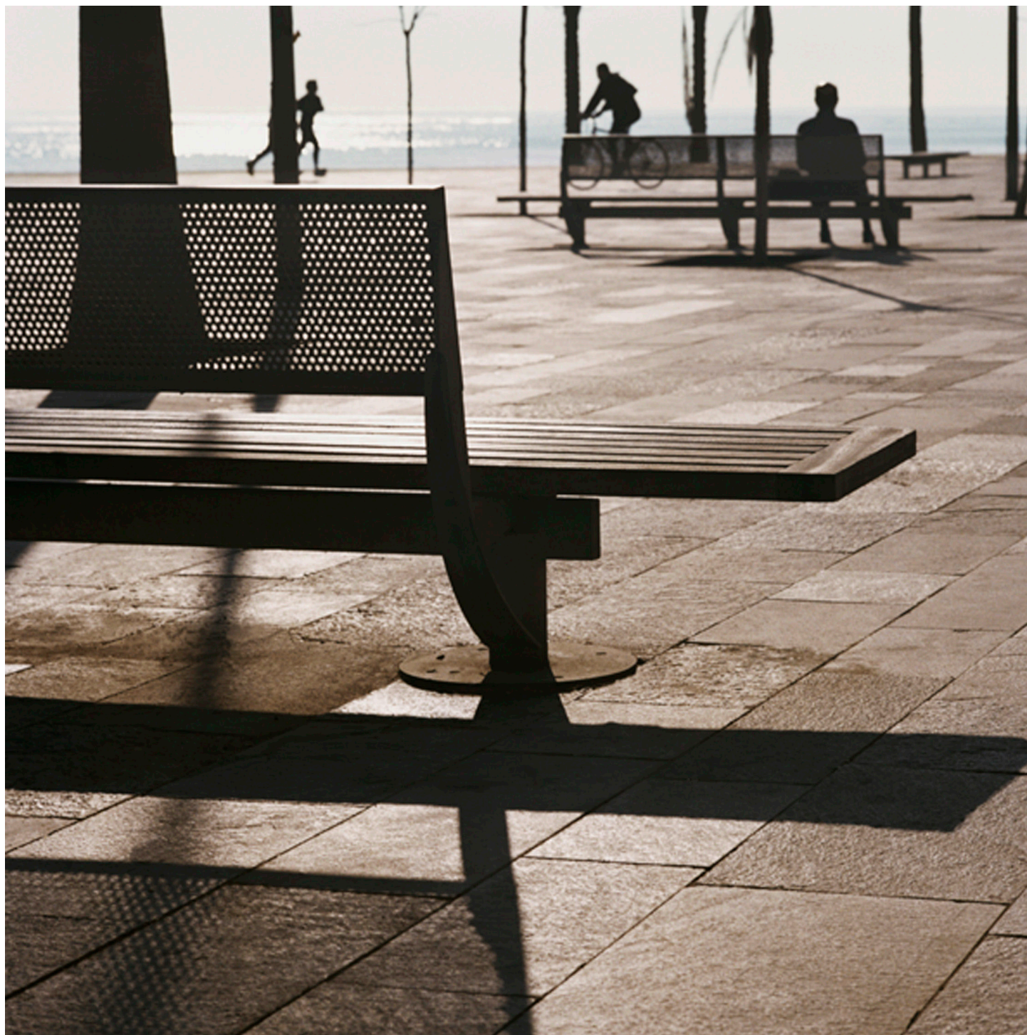
Barceloneta, Barcelona (Espagne)