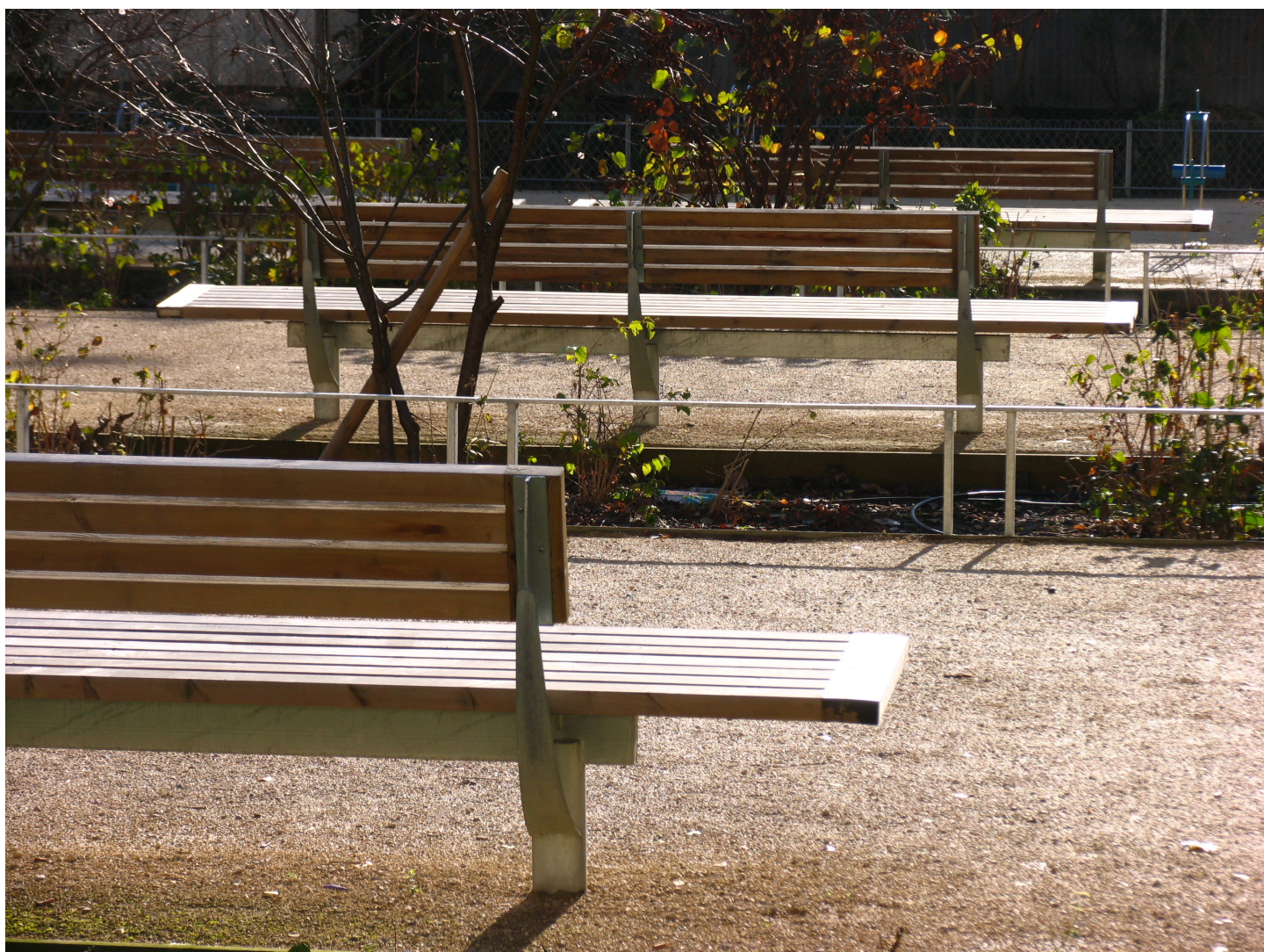
Vacanson, Patin (France)