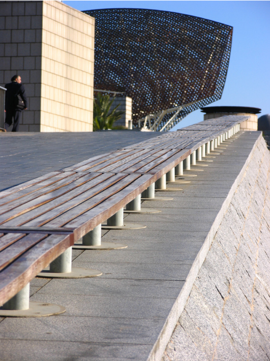
Port Olímpic, Barcelona (Spain)